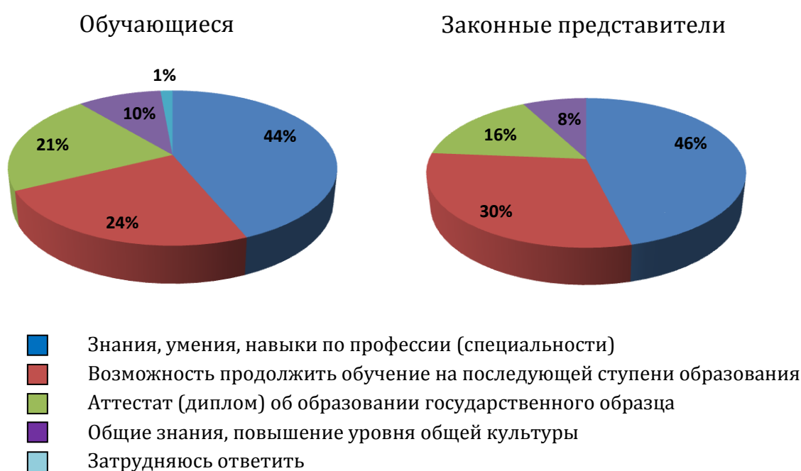
Рисунок 3 – Ожидаемые результаты обучения для обучающихся и законных представителей

Рассмотренные особенности мотивации обучающихся и их законных представителей при выборе образовательного учреждения проявляются и при анализе ожидаемых результатов обучения (см. рис. 3). Наиболее значимым для обучающихся и родителей является получение знаний, умений и навыков по выбранной профессии (специальности). При этом родители придают большее значение возможности продолжить обучение своего ребенка по окончании учреждения НПО/СПО, чем обучающиеся. Для последних сравнительно более важным является получение диплома, наличие которого, по мнению многих из них, является необходимым и достаточным условием как для продолжения обучения, так и для трудоустройства. Получение общих знаний и повышение уровня общей культуры в качестве ключевого результата отметило наименьшее количество обучающихся и родителей, что характеризует узкопрофессиональную направленность обучения в НПО/СПО.